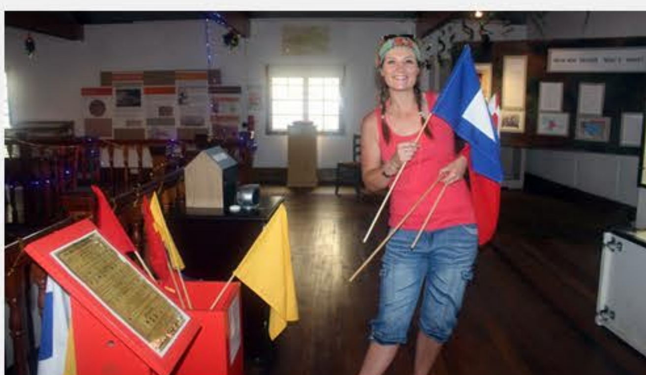
Hier is ek in die museum.

Ons behoort so teen Maart, April volgende jaar terug te gaan na Suid-Afrika. Omdat ons vir 'n konstruksie maatskappy werk, weet ons nie presies wanneer of waarheen ons gaan nie. Die een ding wat hierdie projek my geleer het, is dat die volgende kontrak ook 'n fantastiese ervaring sal wees.