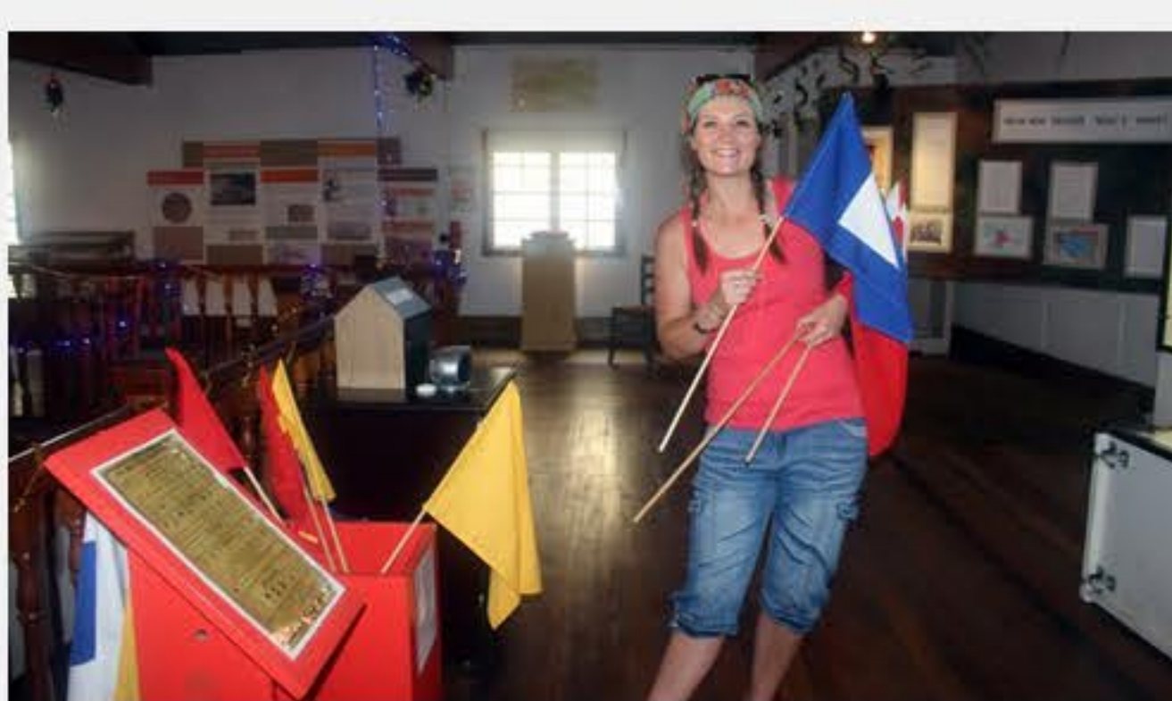
Hier is ek in die museum.

Ons behoort so teen Maart, April volgende jaar terug te gaan na Suid-Afrika. Omdat ons vir 'n konstruksie maatskappy werk, weet ons nie presies wanneer of waarheen ons gaan nie. Die een ding wat hierdie projek my geleer het, is dat die volgende kontrak ook 'n fantastiese ervaring sal wees.