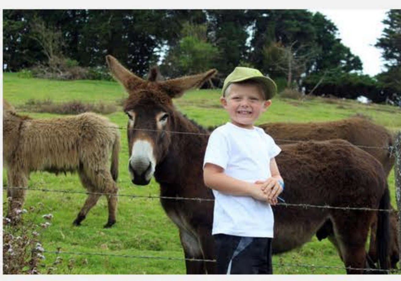
Lourens by donkies op die eiland.

Om nie KFC op 'n Vrydagaand te kan kry nie! (Lag) Ek dink die ergste is dat die enigste manier om van die eiland af te kom, is met die RMS St. Helena en dan vyf dae te reis voordat jy Kaapstad bereik (maar dit maak die plek ook uniek). Om weg te wees van ons families. Mens kan nie vinnig vir 'n naweek weggaan nie.